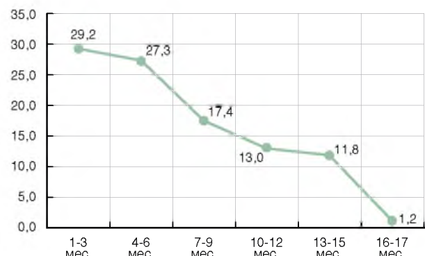
Рис. 2. Доля прервавших лечение больных в зависимости от длительности химиотерапии, %